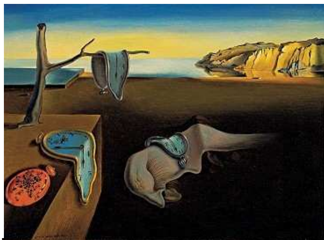
Salvador Dalí. La persistencia de la memoria . 1931.

Alla icke-åskådliga frågor är dock inte av denna figurativa art utan är verkligen icke-åskådliga medan frågaren trots det söker ett svar som om de vore åskådliga. Vi kan nu tänka oss att den gamle mannen verkligen menade sin fråga bokstavligt. Han efterfrågar inte minnen eller mänsklig närhet utan söker, rent faktuellt, den förflutna tidens lokalitet i rummet.