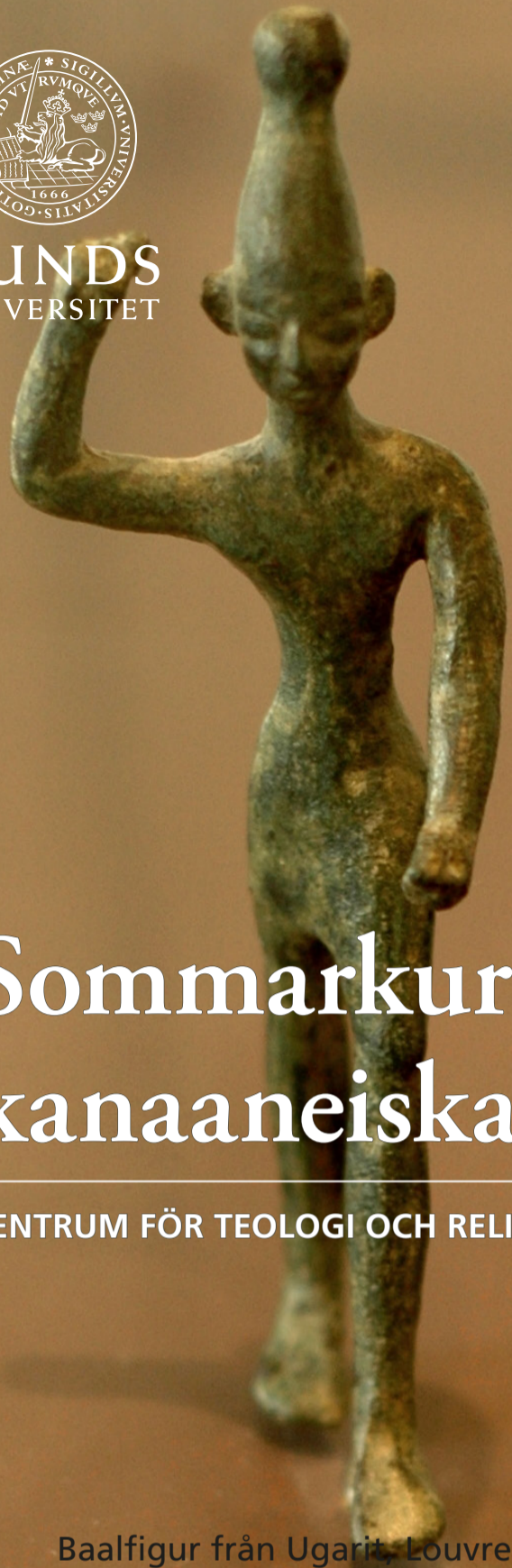
Baalfigur från Ugarit, Louvren