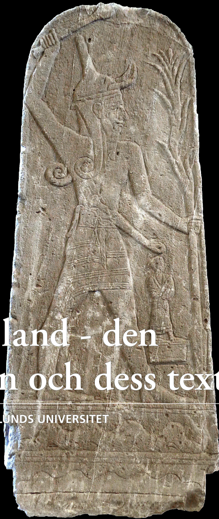
Baal med åskvigg, Louvren