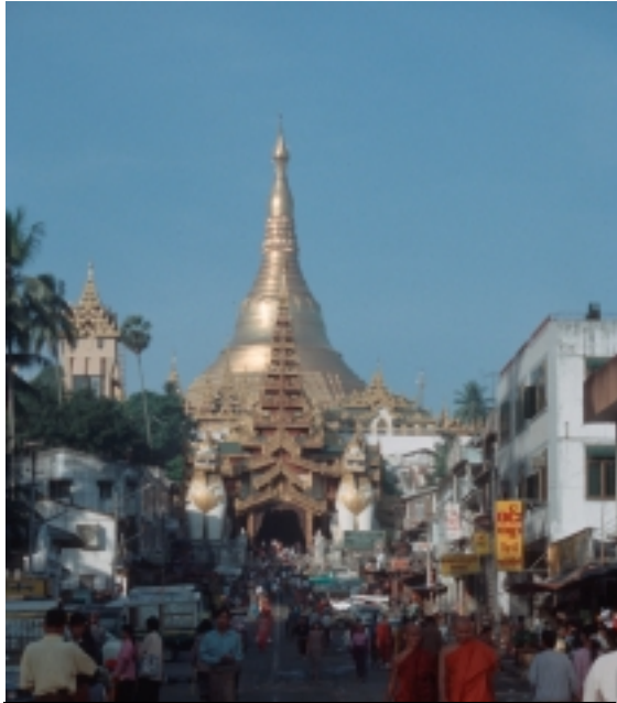
Shwedagon pagoden i Rangoon är landets religiösa centrum. Här sägs relikier från fyra tidigare Buddhor finnas inneslutna i pagodens bas. Shwedagons dagò , religiösa kraft, är därför mycket stor, och det är för att ta del av denna kraft som människor kommer hit.

från huvudstaden Rangoon. Klostret äger ett stort område av kullarna och upplåter mark till människor som söker en tillflykt undan inbördeskriget som råder i de etniska minoriteternas områden i Burma. Närmare 4000 Karen-flyktingar uppges bo här.