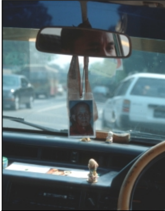
I taxibilarna i Rangoon hänger ofta foton på den högt vördade Thamanya Sayadaw.

Katarina Plank, FM, doktorand i religionshistoria