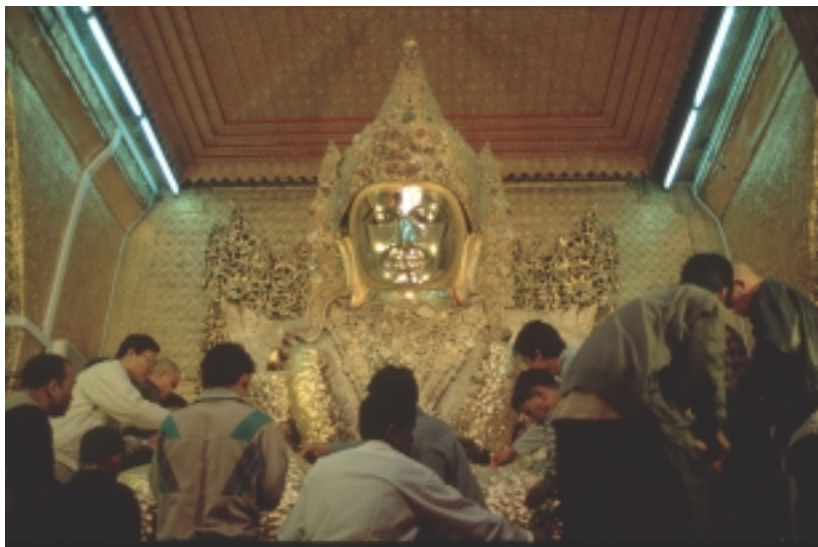
Mahamuni Buddha i Mandalay är ett av landets viktigaste pilgrimsmål. Hängivna lekmän applicerar tunna lager av bladguld på statyn – på statyns knän är guldlaget nära 15 centimeter tjockt.

De buddhistiska aspekterna av den politiska krisen i Burma har i det närmaste blivit helt negligerade – vilket är förvånande eftersom landets munkar har spelat, och spelar, en framträdande roll i protesterna mot militärregimen. Både militärregimen och motstånds-