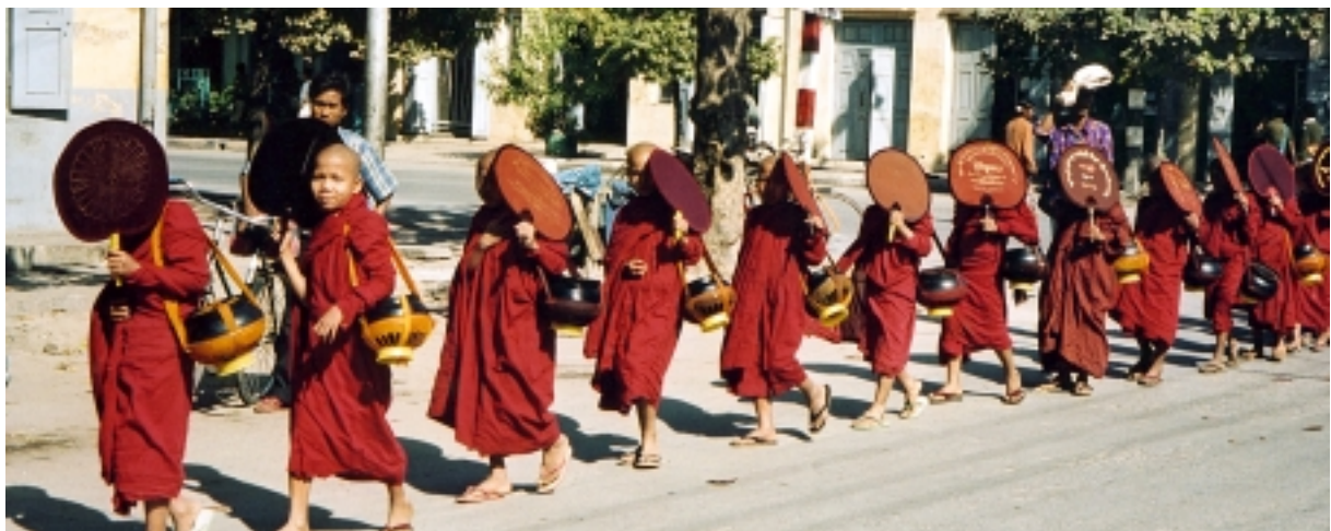
Ömsesidigt utbyte och beroende: genom att skänka materiellt bistånd till sanghan erhåller lekfolket religiösa meriter. Under novismunkarnas vandring genom Mandalays gator mottar de mat och pengar i sina svarta korgar.

Trots flera försök har militärregimen aldrig fullt ut lyckats få full kontroll över munkskapet. Sanghan spelade en viktig roll för demokratirörelsen under och efter protesterna 1988. Klostren blev fristäder för fattiga studenter och politiska dissidenter. Efter att regimen fängslat alla sina motståndare, flyttade den politiska arenan till munkskapet.