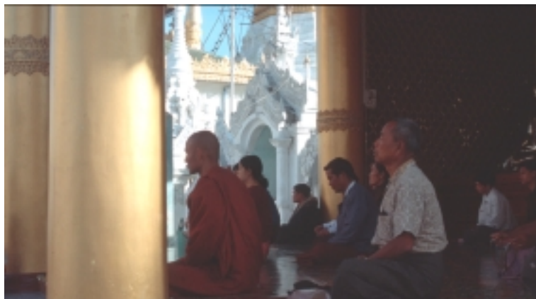
Meditationspraktik är utbredd i Burma. Både munkar och lekfolk kan ses meditera på en plattform vid Shwedagon pagoden i Rangoon.

Sedan början av 1990-talet vinnlägger sig regimen om att visa upp en religiös sida, vilket är en ny politisk strategi från deras sida. När Burma vann sin självständighet 1948, och U Nu tillträdde som landets första (och hittills enda) demokratiskt valda premiärminister, var ett av hans mål att återställa sanghans ställning till den status den haft före den brittiska kolonialmaktens styre. (Britternas avsättande av lokala burmesiska kungar förde med sig att sanghan stod utan beskyddare, det vill säga: det fanns inte längre någon patron som kunde sponsra pagod-byggen eller utse thathanabaing , sanghans högsta centrala auktoritet.) U Nu förde en tydlig buddhistisk politik – han ville skapa en upplyst regering och uppmuntrade sina