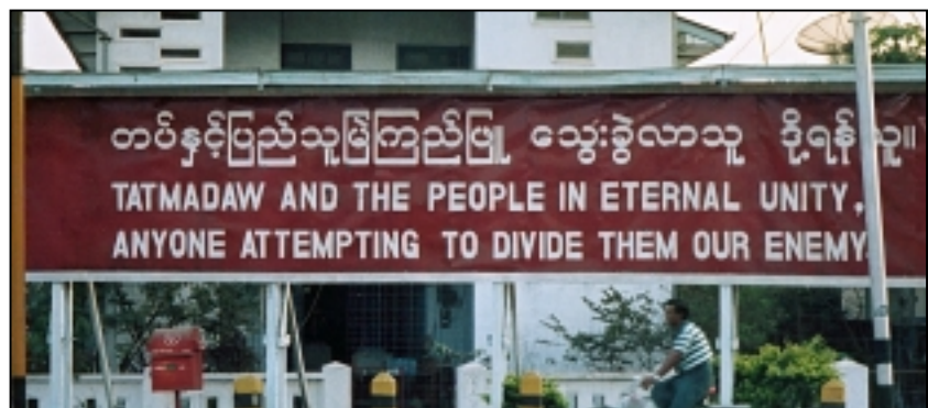
Runt om i städerna finns stora anslag med militärpropaganda. Här påminner Tatmadaw , militären, om att den som är emot ett enhetligt Burma därmed också är en fiende till både staten och medborgarna.

Innan ankomsten till Burma fick jag rådet att aldrig prata politik offentligt; risken är överhängande att militärregimen fängslar de burmeser som öppet kritiserar hur landet styrs. I ett land där ett icke-auktoriserat innehav av