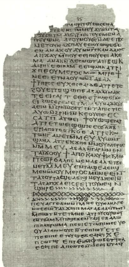
Första sidan av Sanningens evangelium.

Alexandria. Klemens av Alexandria berättar om att vissa valentinianer vidhöll att Valentinus under sin utbildning i Alexandria studerat under en viss Teudas, en av Paulus förmodade lärjungar, och Epiphanius skriver att Valentinus själv också predikade i Egypten. Runt år 140 reste dock Valentinus till Rom där han med tiden samlade en skara kristna runt sig och ledde en församling. Det är värt att påminna oss om att det under denna tid inte fanns någon centraliserad kyrka i Rom och inte heller en fastställd kanon.