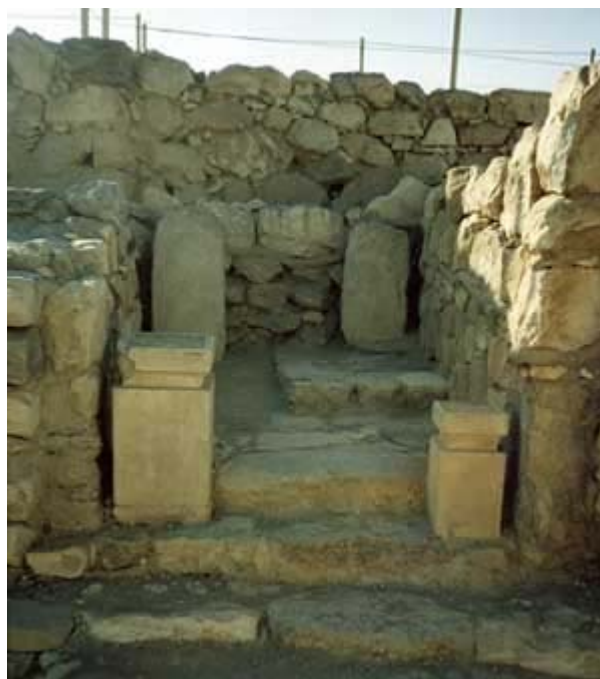
Fig 2 Aradtemplets allraheligaste. I bakgrunden två masseboth. Framför dessa har två altaren placerats. Föremålens placering utgör en rekonstruktion.

Aradtemplet verkar vara uppfört på en äldre kultplats som haft karaktären av friluftshelgedom, som är den typ av kultplats som masseboth vanligen hör hemma i. I sammanhanget ska det noteras att västsemitiska tempel ofta byggdes på platser för äldre friluftshelgedomar. Detta kan därför vara en förklaring till varför kombinationen tempel och masseboth påträffats i Arad. Vidare kan detta också visa på det faktum att masseboth och den tomma tronen i det allraheligaste uppfattats som liknande storheter, nämligen som symboler för gudomlig närvaro. Vad gäller antalet masseboth i Arad, går den senaste diskussionen isär.